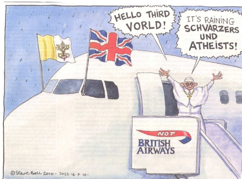
Paven ankommer (The Guardian 16. September 2010).

Dagen før paven skulle ankomme til Edinburgh, trykte det tyske magasin Focus et interview med kardinal Walter Kasper om det forestående besøg. Heri udtalte han, der indtil for nylig var chef for Vatikanets kontor for inter-religiøs dialog, at "England er i dag et sekulært og pluralistisk land. Undertiden, når man lander i Heathrow, føler man, at man er kommet til et tredje verdensland." Desuden hævdede han, at "en aggressiv ny ateisme havde spredt sig i England."