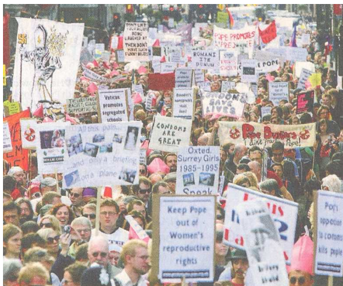
Protestmarchen mod Downing Street, London

Kun i London fandt en organiseret protestmarch sted. Arrangørerne havde regnet med 2.000 deltagere, men ifølge én avis deltog 12.000, ifølge en anden 20.000 i protesten, der var arrangeret af "British Humanist Society". Mange deltagere bar t-shirts med teksten "Pope Nope", der var blevet den sekulære modstands slogan. Mange var det vel ikke i en millionby som London, men som sagt: det helt overvejende flertal af den engelske befolkning var fuldstændig ligeglads med besøget. På den anden var det vist også første gang, man oplevede en større, organiseret protest mod en pave. Den kom jo mod forventning ikke, da han i 2008 besøgte New York med dens store gay community.