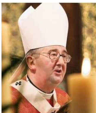
Diarmuid Martin, ærkebiskop af Dublin

Nu viser en undersøgelse, at mindst 11 ud af republikkens Irlands og Nordirlands 4 ærkebispedømmer og 22 bispedømmer har alvorlige økonomiske problemer. Årsagerne hertil er faldende messedeltagelse og dermed formindskede kollektindtægter, den almene økonomiske recession og betaling af erstatninger til ofre for præsters og ordensfolks overgreb.