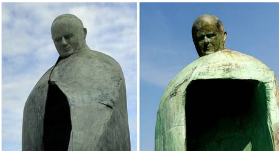
Den nuværende statue til venstre, den oprindelige til højre